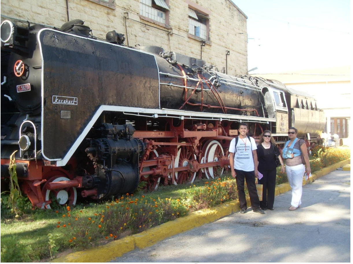
İlk yerli yapımı Lokomotif Karakurt- Eskişehir TÜLOMSAŞ Lokomotif Fabrikasında