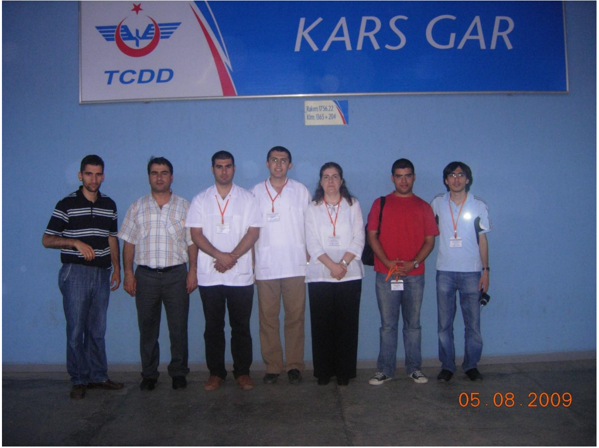
Kars Tren garında