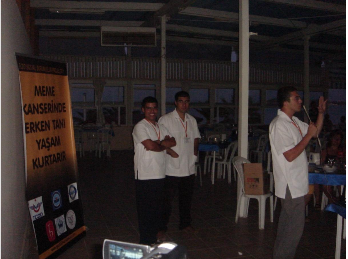
İzmir Urla TCCD kampında akşam yemeği sonrasında meme kanseri bilgilendirmesi