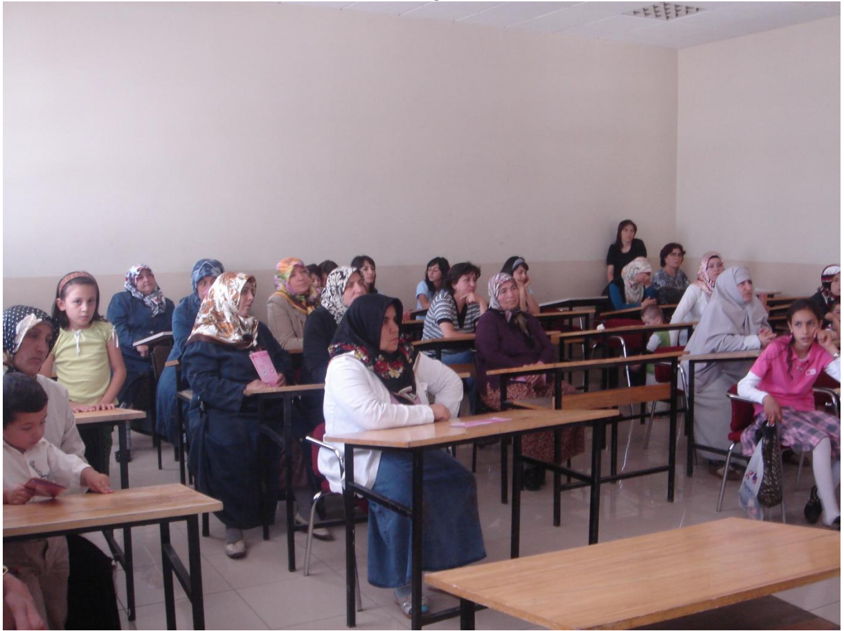
Erzincan Gar etkinliğinde