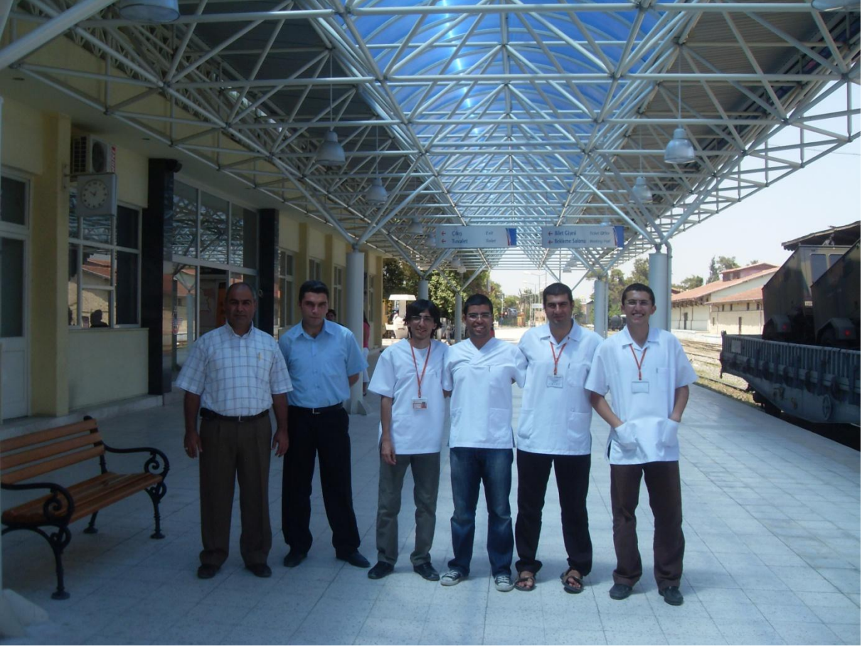
Denizli Gar önünde