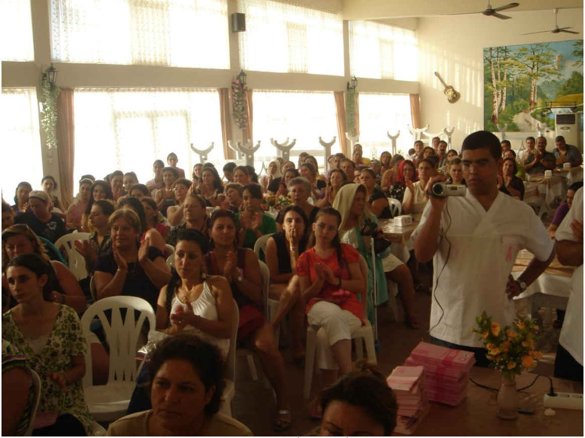
Arsuz TCDD kampında