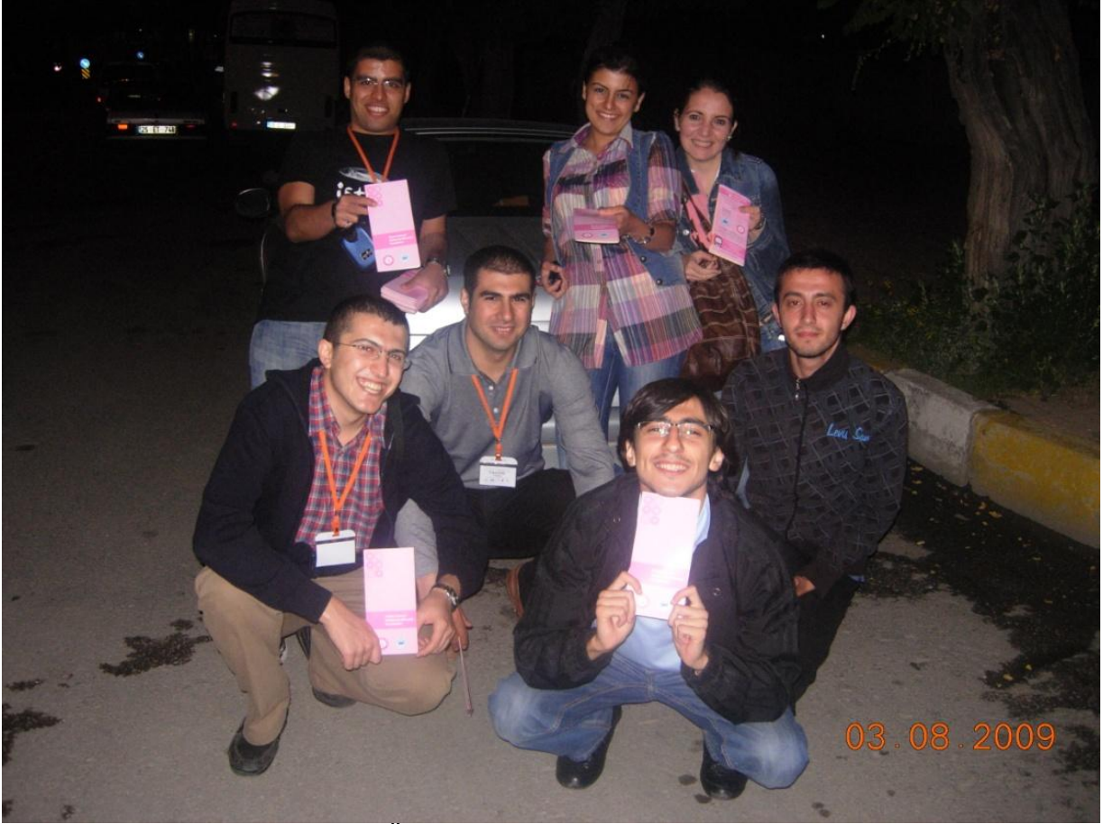
Erzurum Atatürk Üniversitesi Tıp Fakültesi öğrencileriyle birlikte