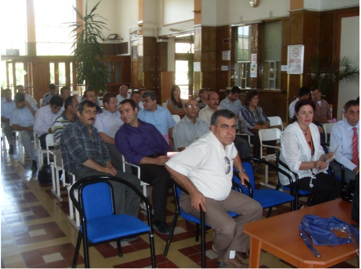
Afyon Gar etkinliđi