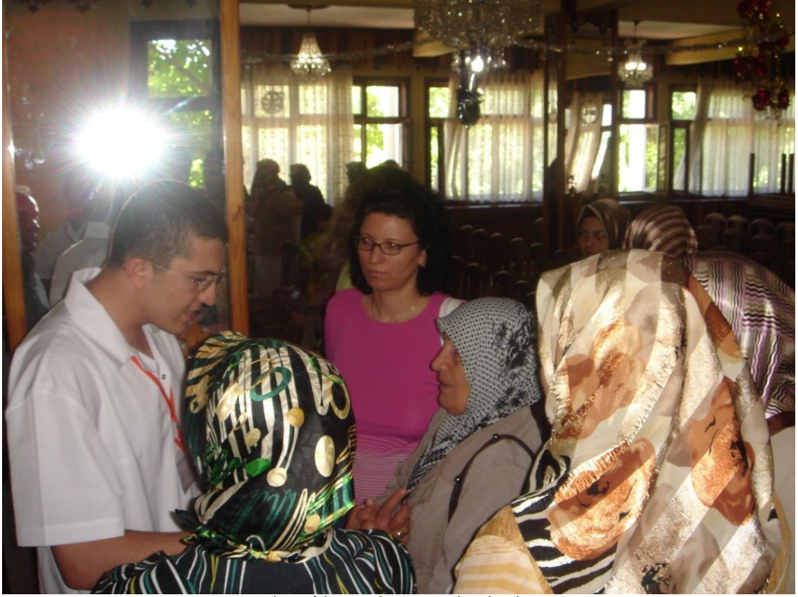
Malatya'da soruları cevaplandırırken