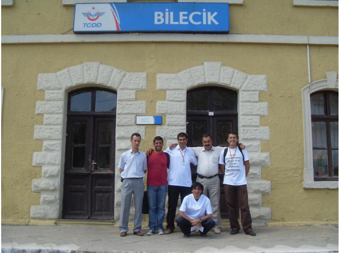
Bilecik Tren Garı etkinliđi sonrası Bilecik Tren gar müdürü ile