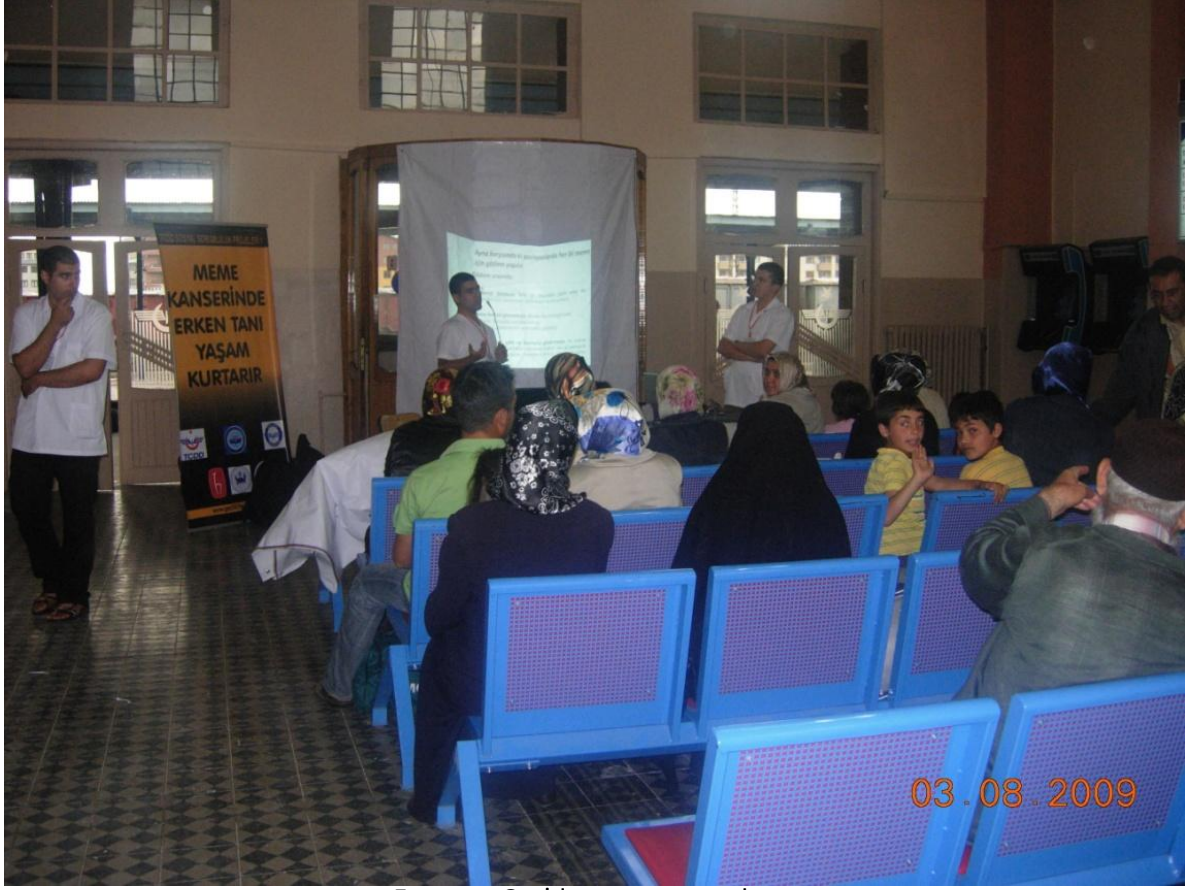
Erzurum Gar'da sunum yaparken