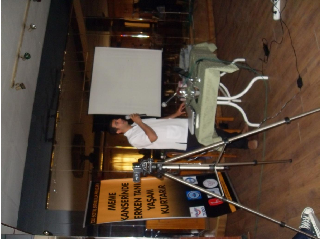
İzmir Urla TCDD kampında akşam yemeği sonrasında meme kanseri bilgilendirmesi