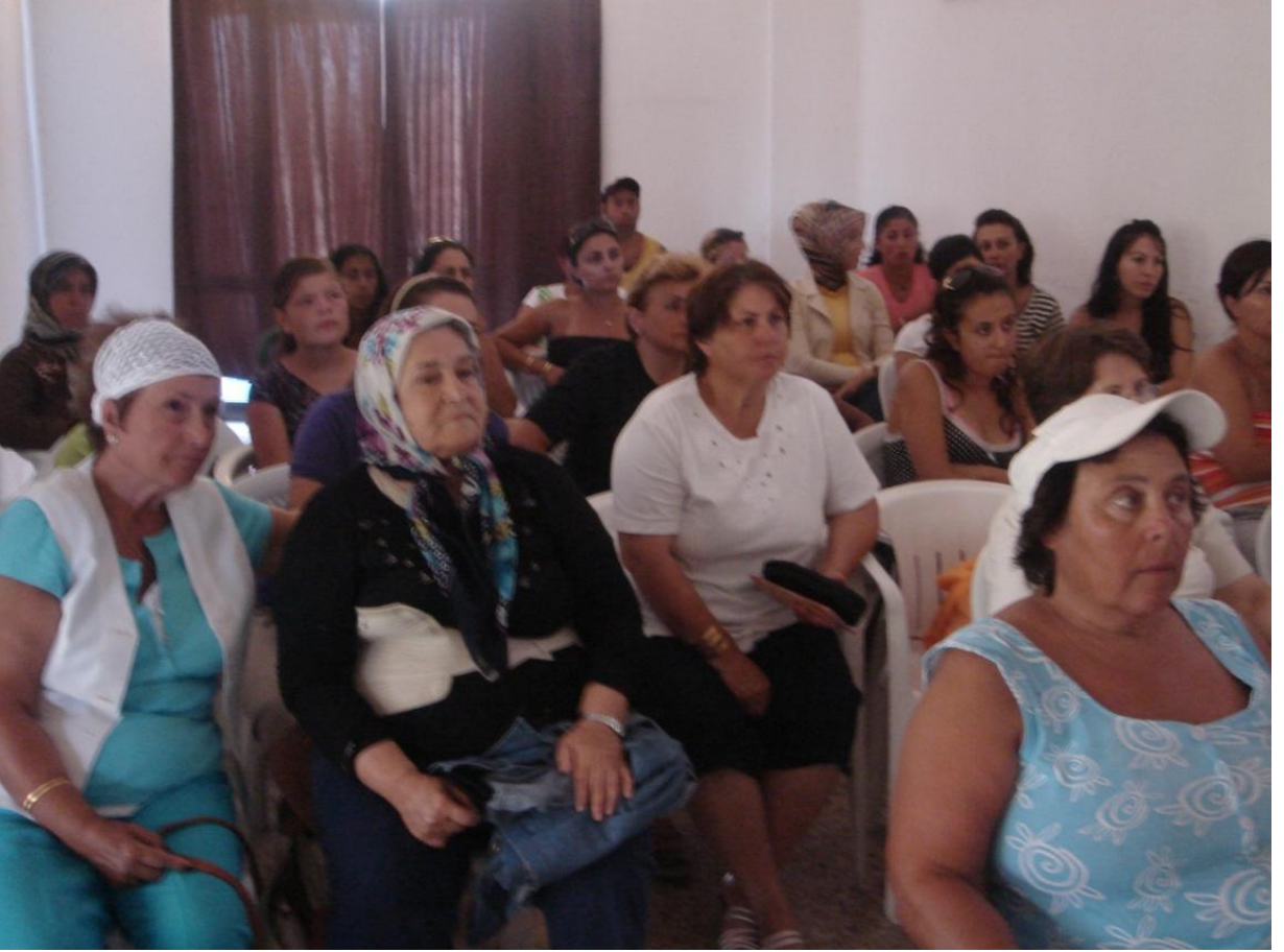
TCDD Balıkesir Akçay kampı etkinliđi