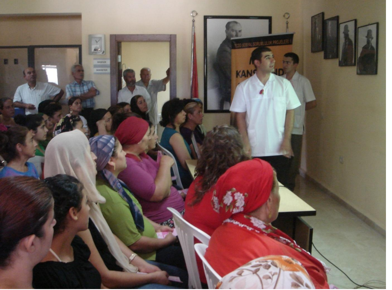
İskenderun Madenli belediyesi