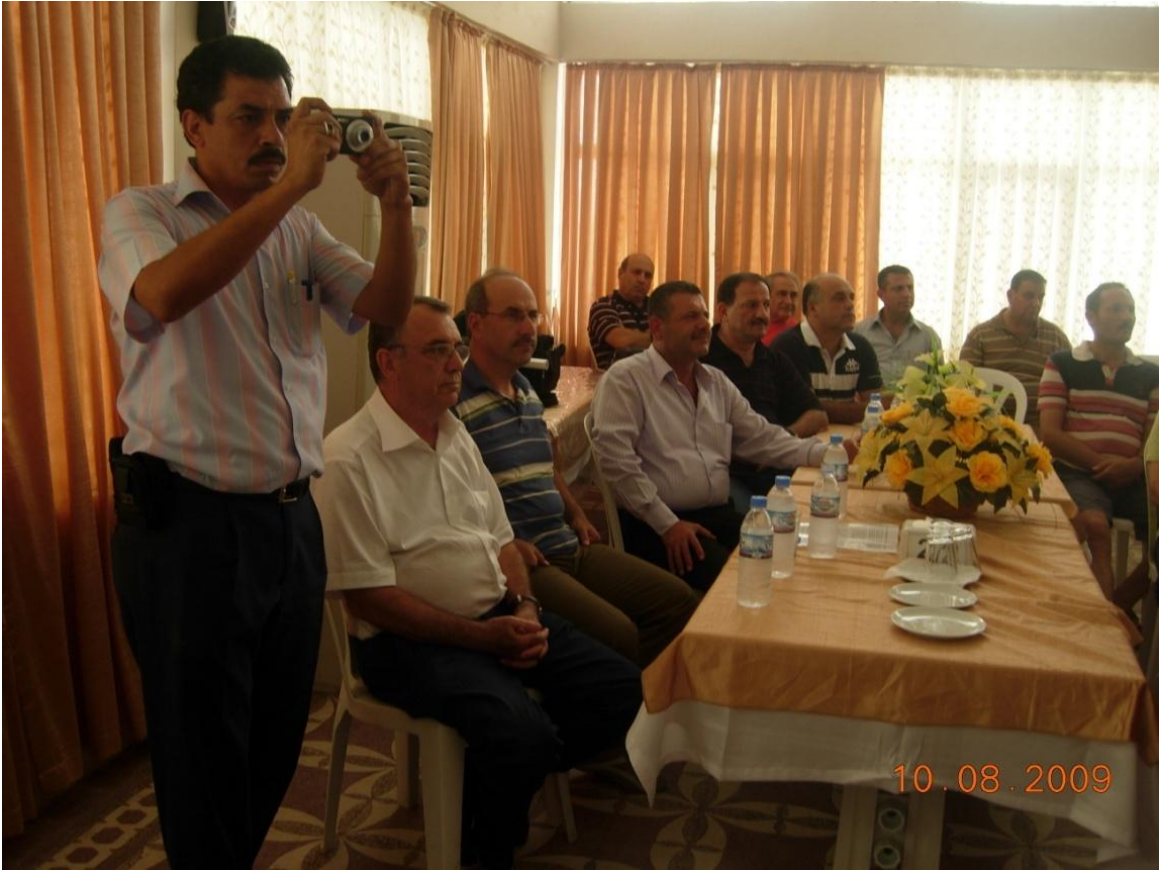
Arsuz TCDD kampında