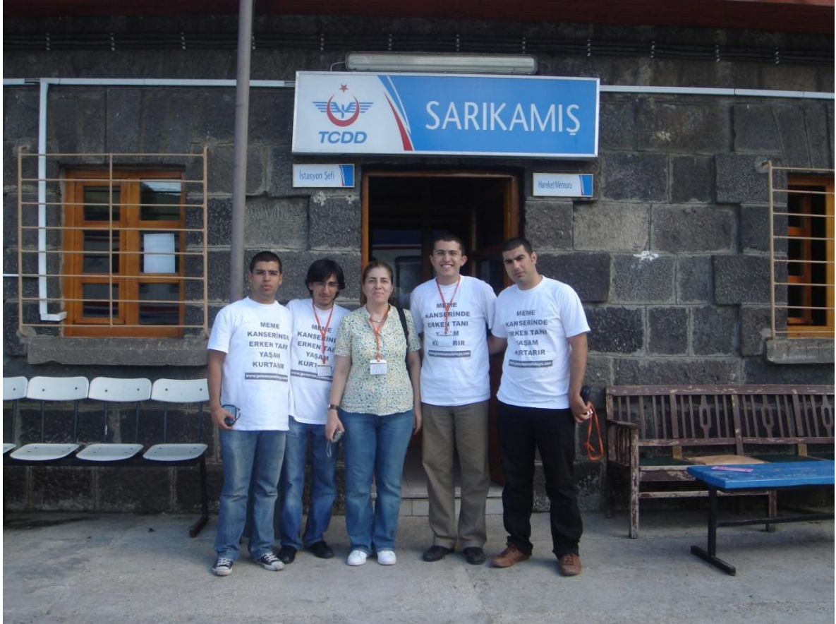
Sarikamis Tren İstasyonunda