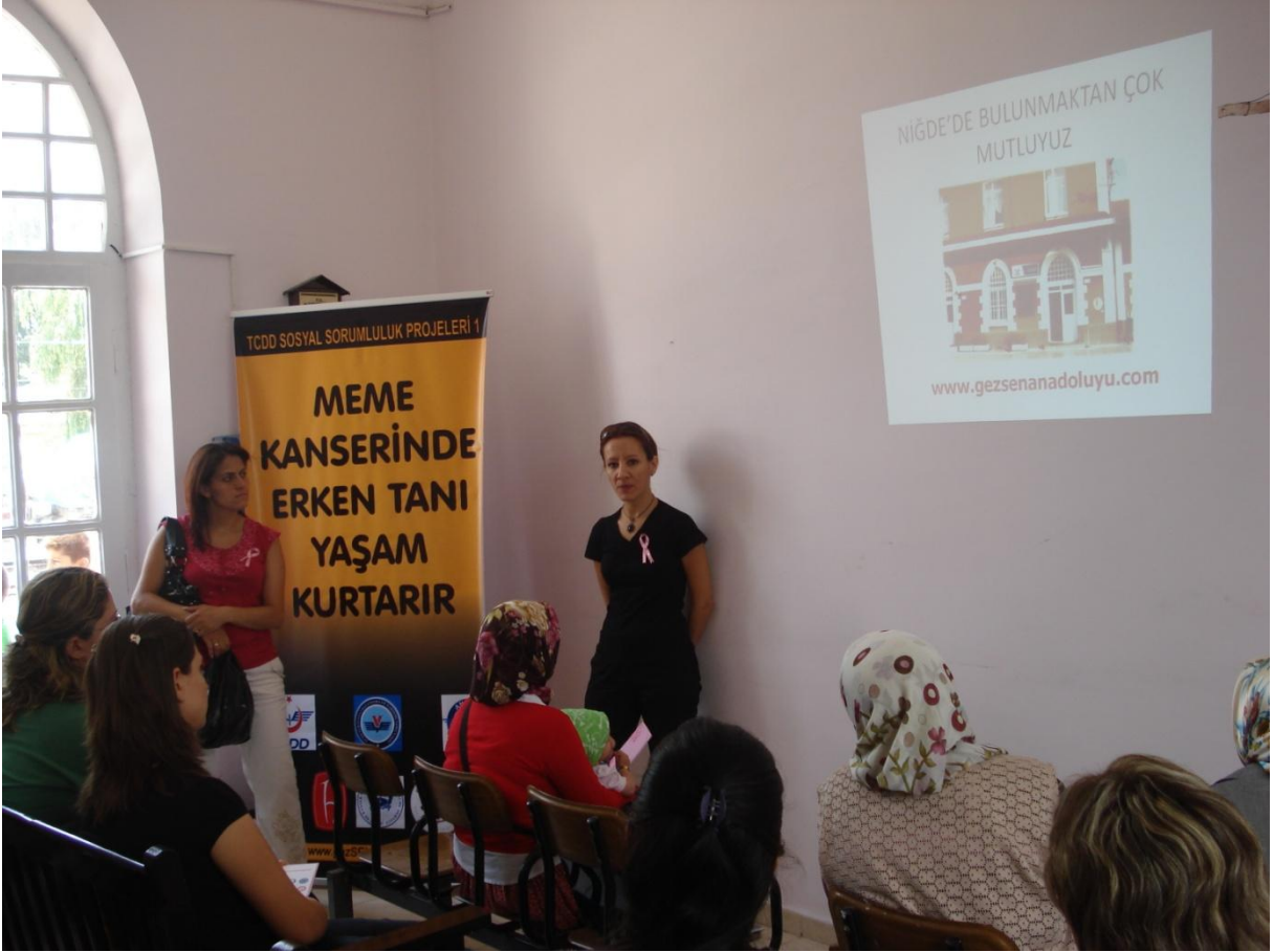
Niğde gar etkinliğinde Niğde Tabip Odası yöneticileri ile birlikte