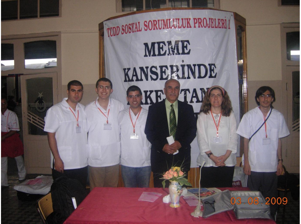
Erzurum Gar Müdürü ile birlikte