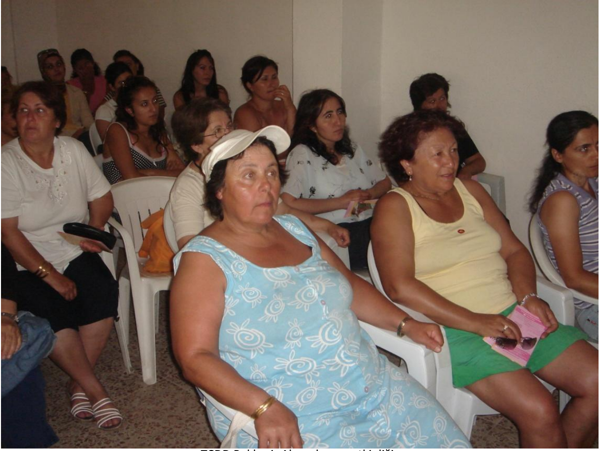
TCDD Balıkesir Akçay kampı etkinliđi