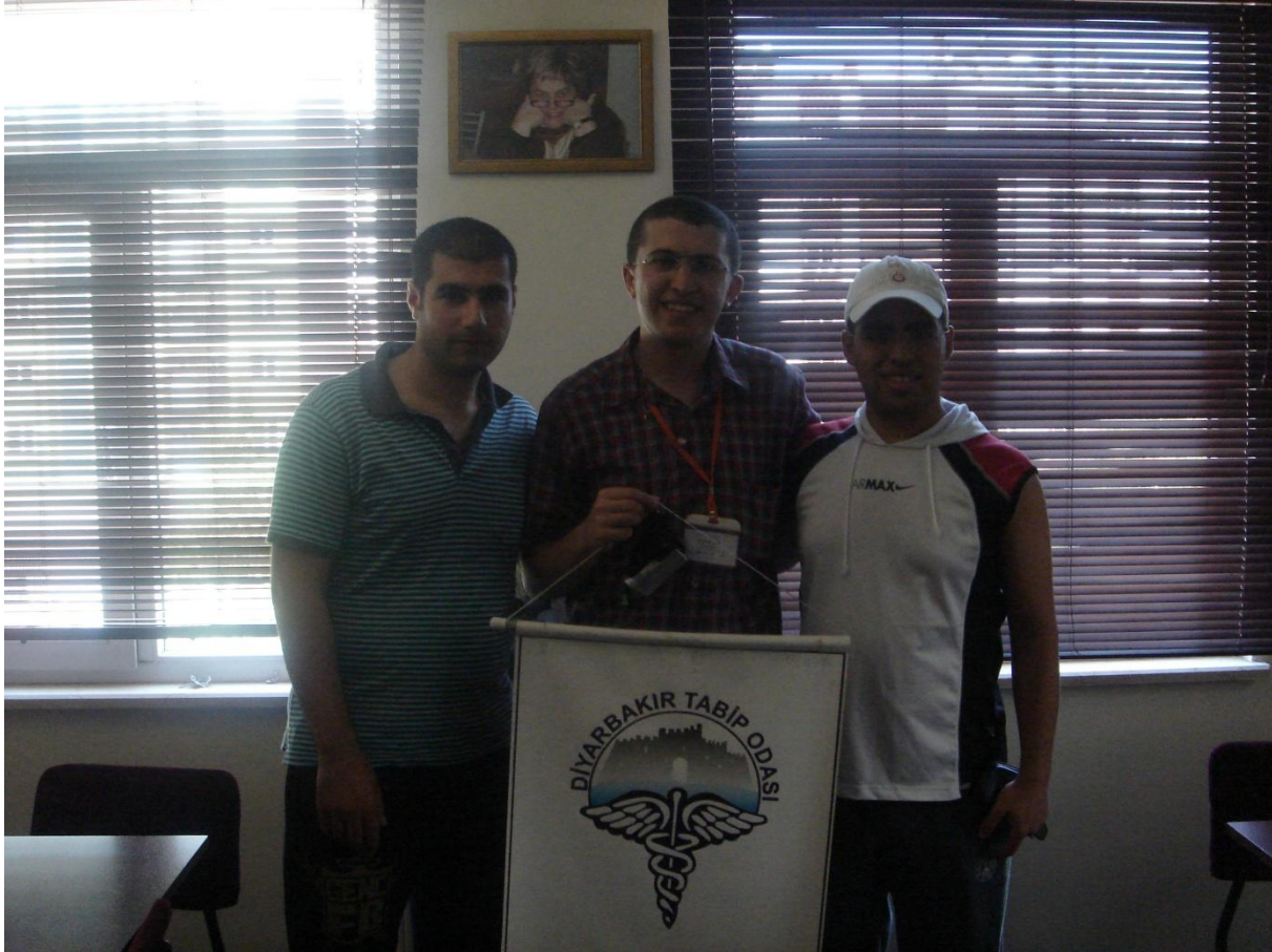
Diyarbakır Tabip Odası'nda Dr. Füsun Sayek adına düzenlenmiş salonda