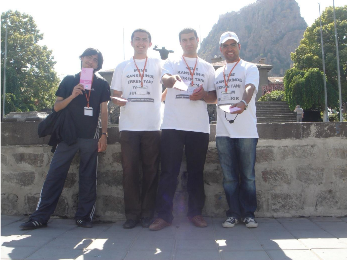
Afyon Zafer anıtı önünde el ilanı dağıtırken