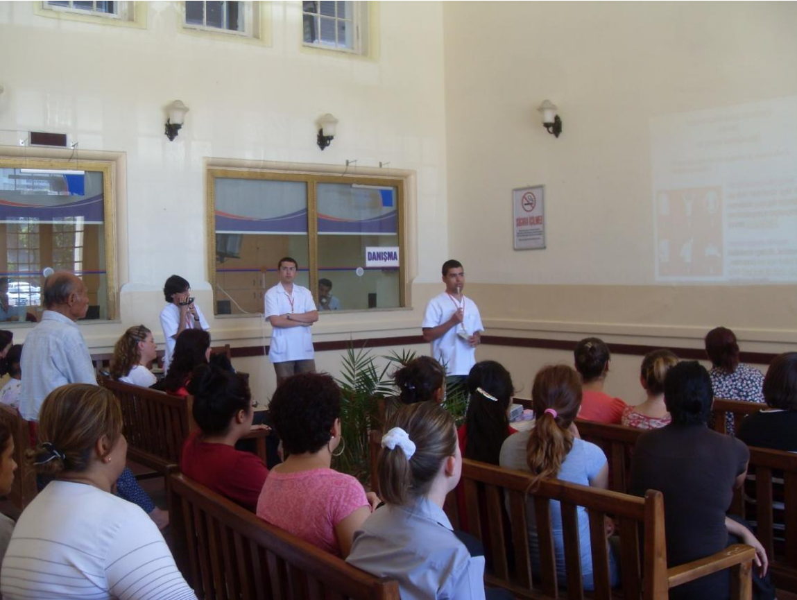
Adana Tren Garı etkinliğinde