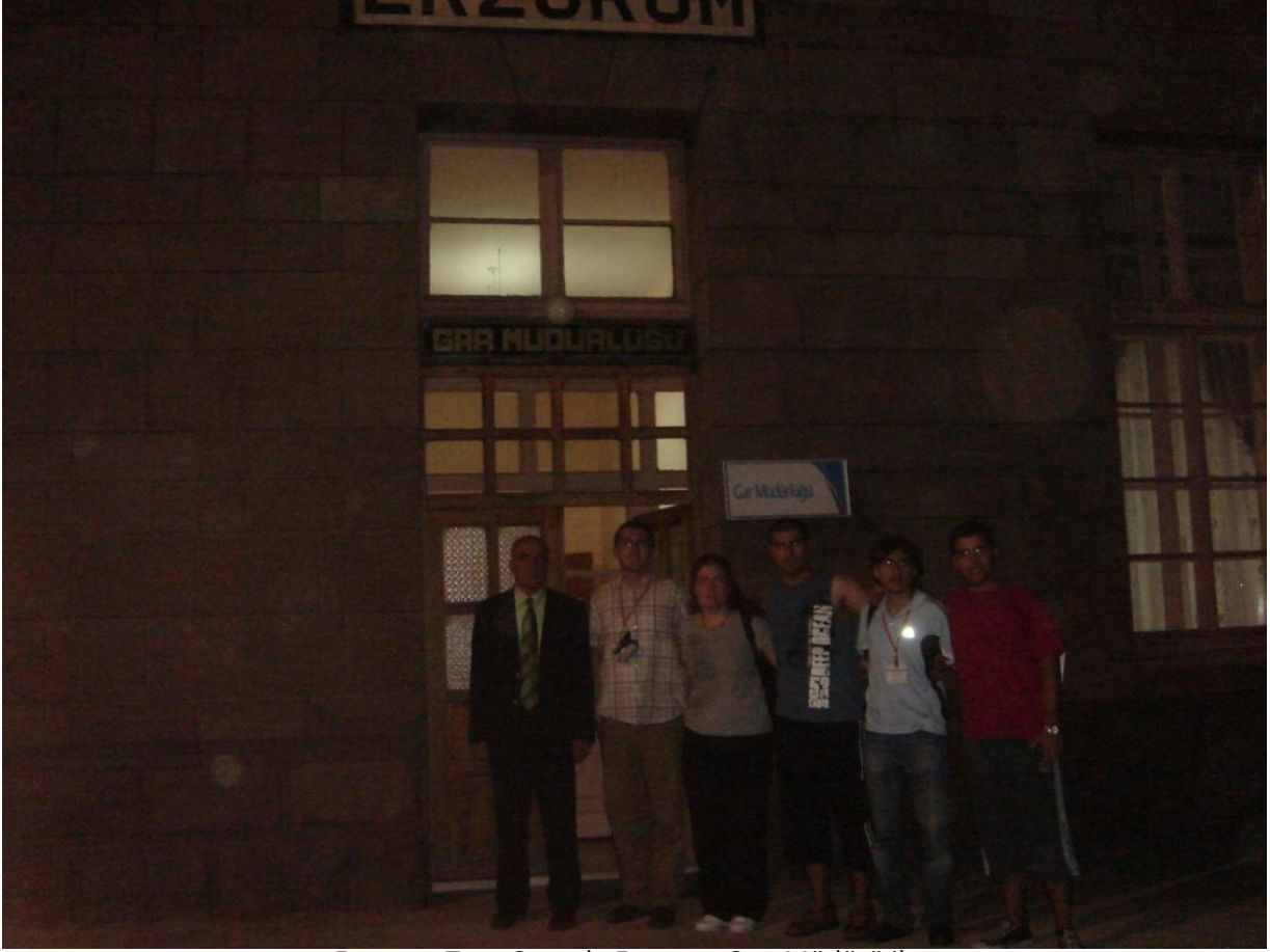
Erzurum Tren Garında Erzurum Gar Müdürü ile