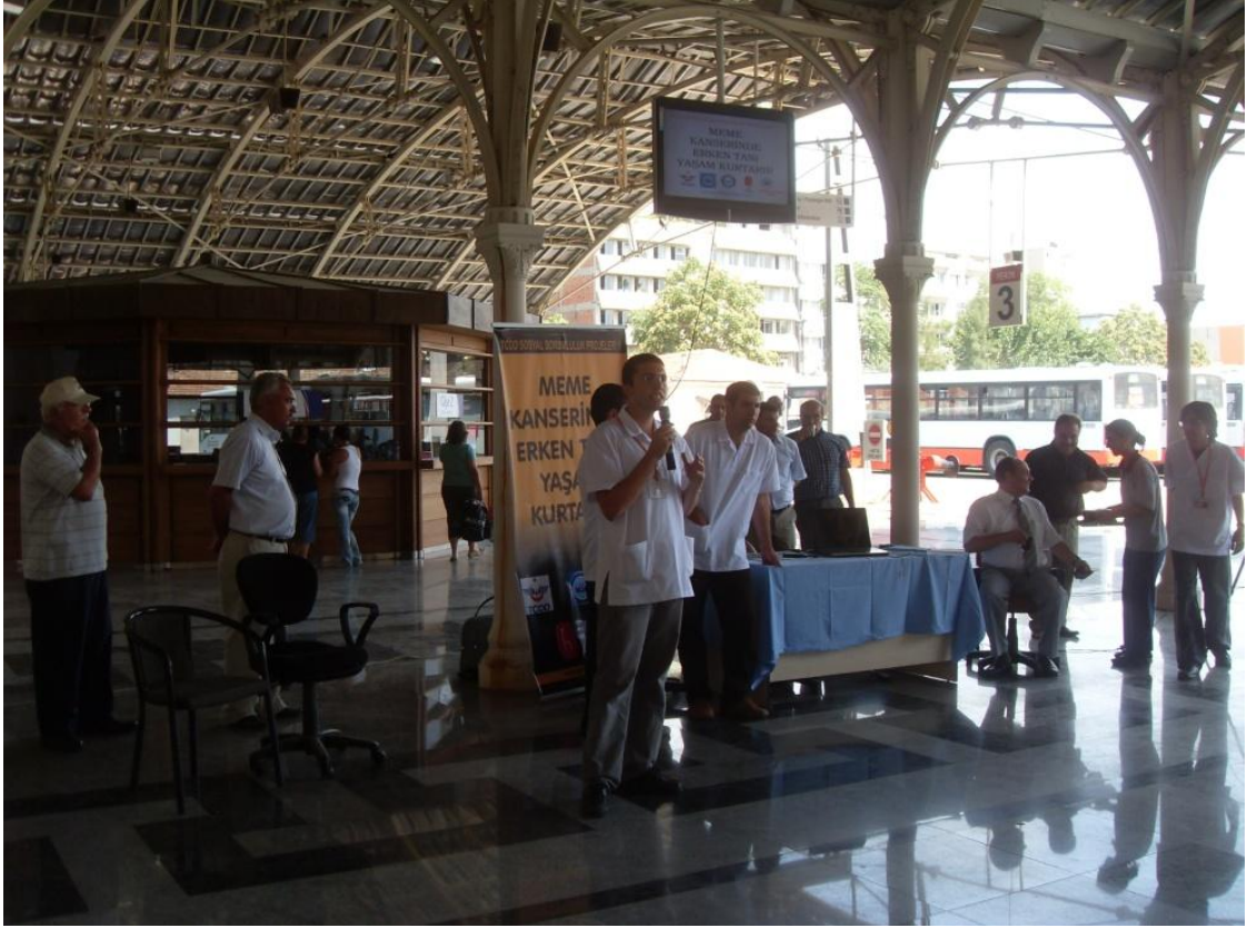
İzmir Basmane Tren Garı etkinliği