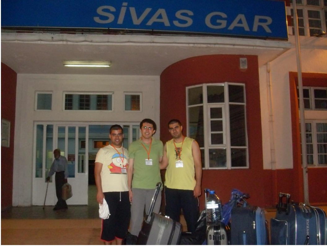
İlk Tren Yolculuğumuz sonunda Sivasta