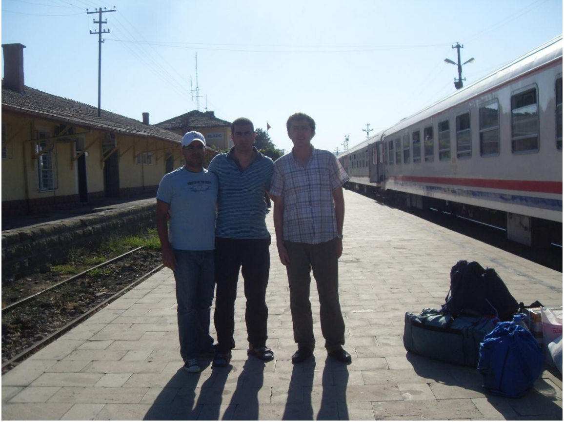
Elazığ Gar'da sabah varışımız