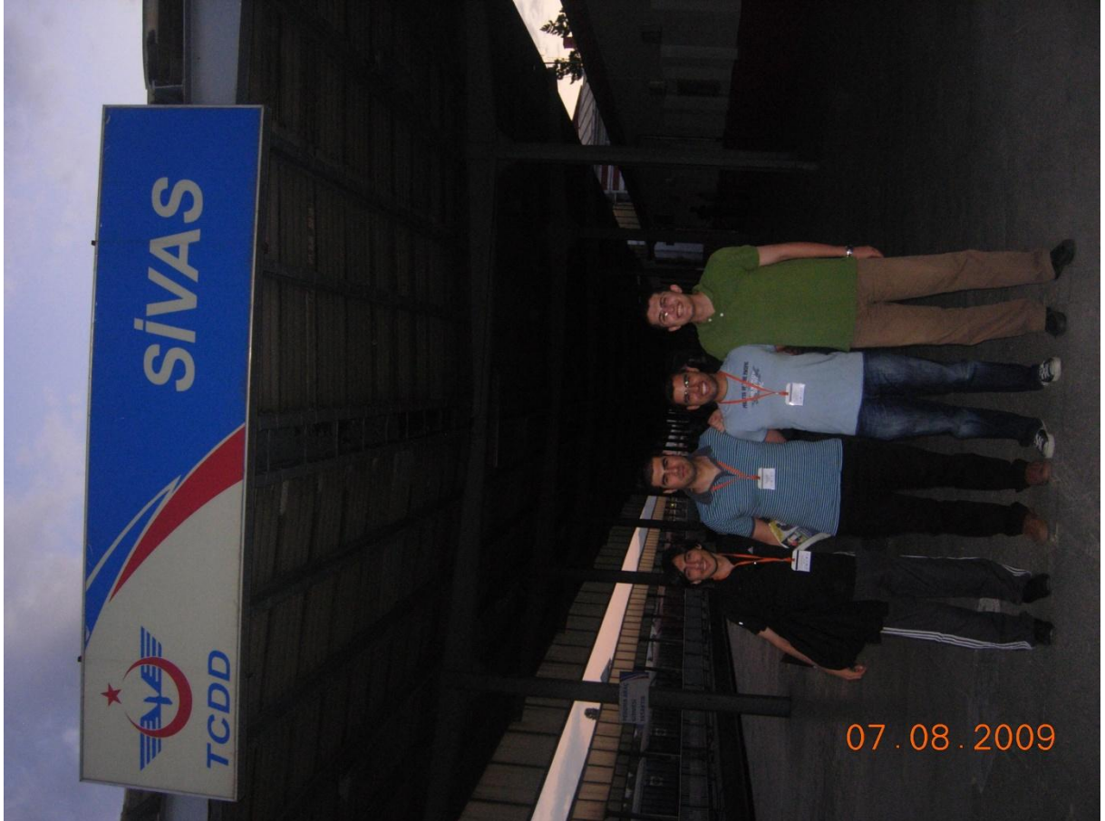
Sivastan Kayseri Boğazköprü üzerinden Niğde ye gitmek için 2.kez ayrılırken