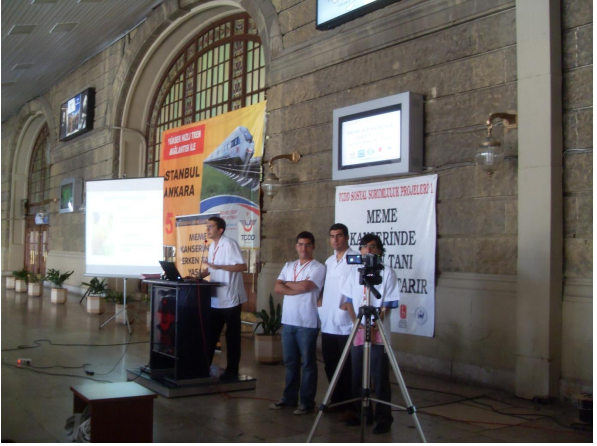
Son sunumumuzu Haydarpaşa Tren Garında yaparken