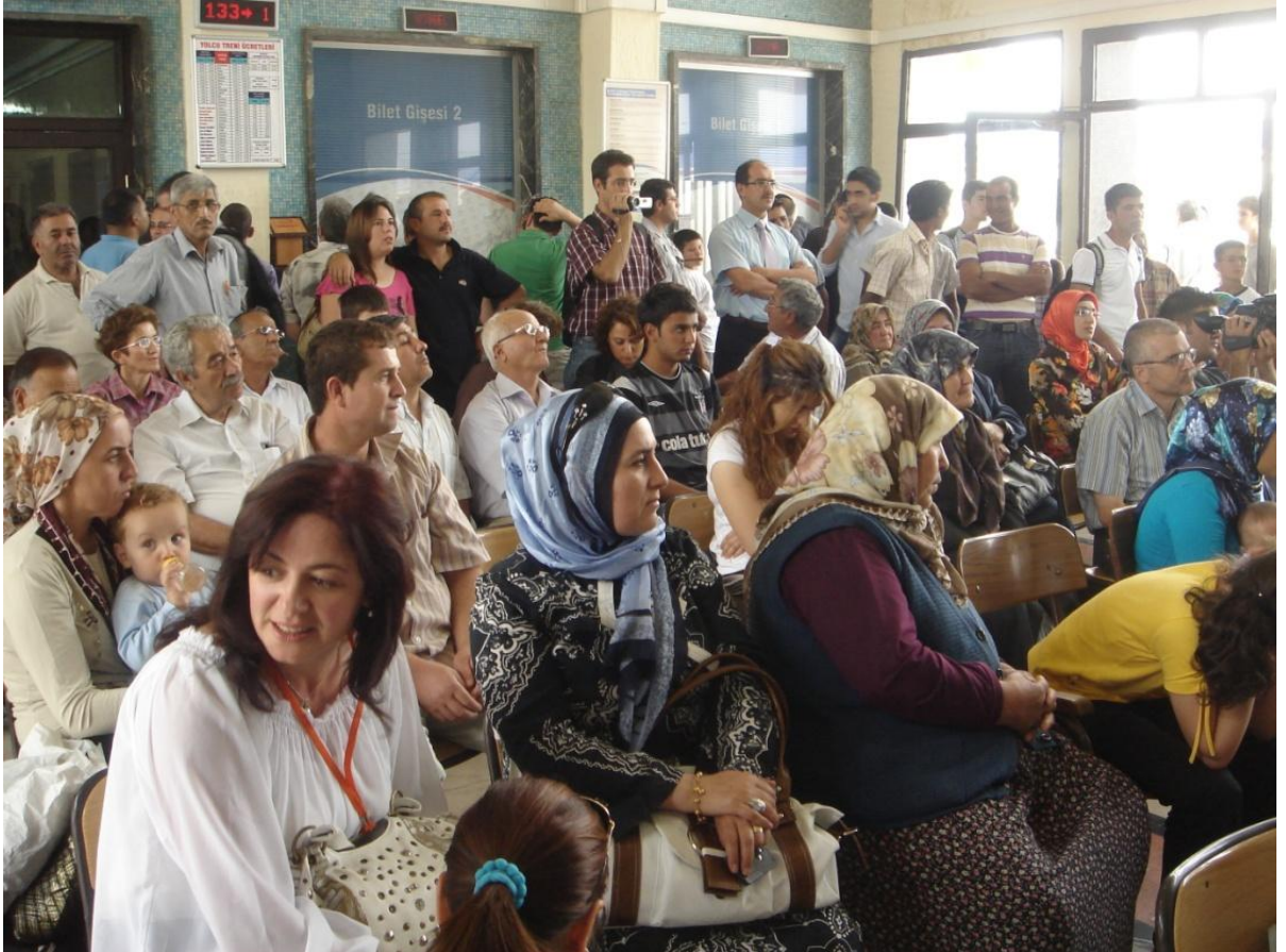
Konya Gar etkinliği