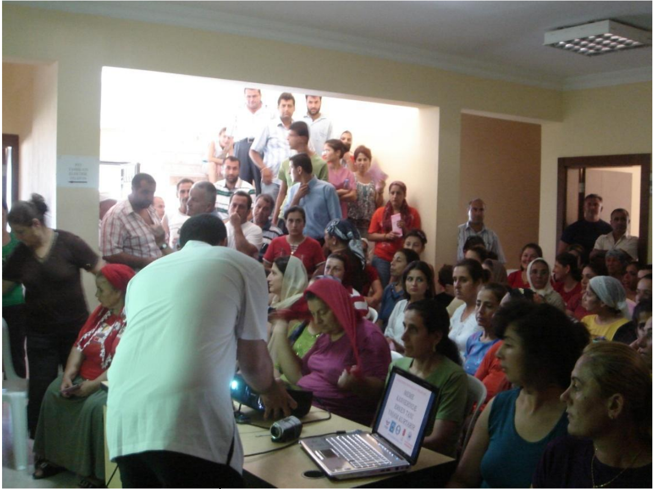
Iskenderun Madenli belediyesi