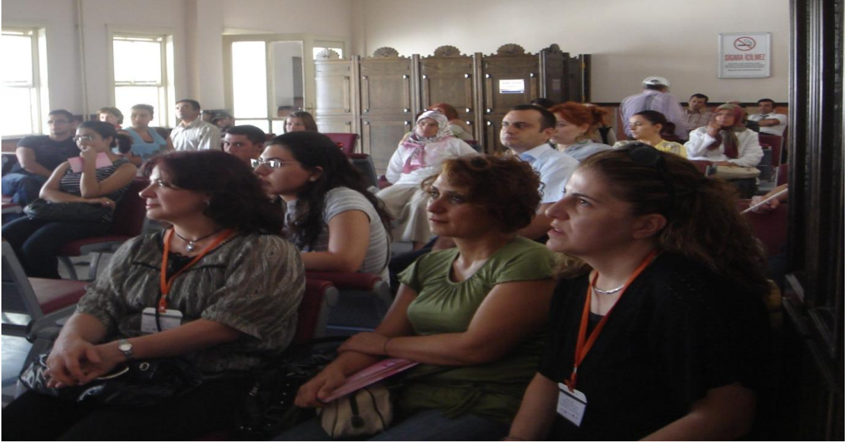
Eskişehir Garı etkinliđi