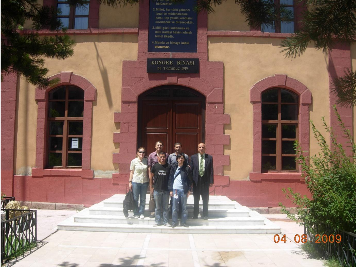
Erzurum Kongresi binası önünde