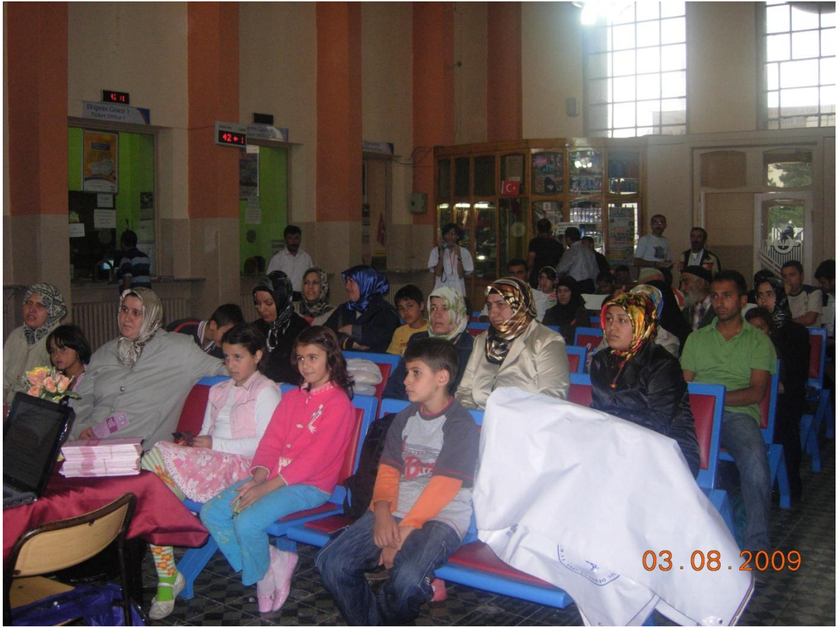
Erzurum Gar'da sunum yaparken