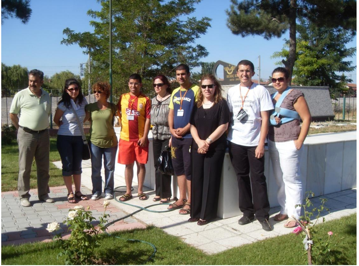
Onuncu yıl marşındaki Demir ağılarla yurdu ördük dört baştan sözünün sahibi 2.Dünya Savaşında İnsanlık adına yüzlerce Yahudiye Türkiye kapısını açan TCDD'nin efsane genel müdürü BÜYÜKELÇİ BehiçBey Behiç Erkin'in 3 yanından tren geçen anıtmezarını Eskişehir de ziyaretimiz