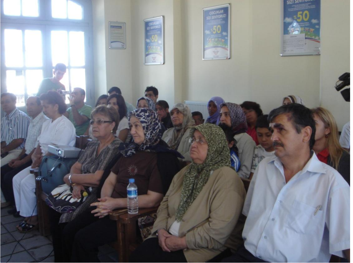
Karaman Gar etkinliği