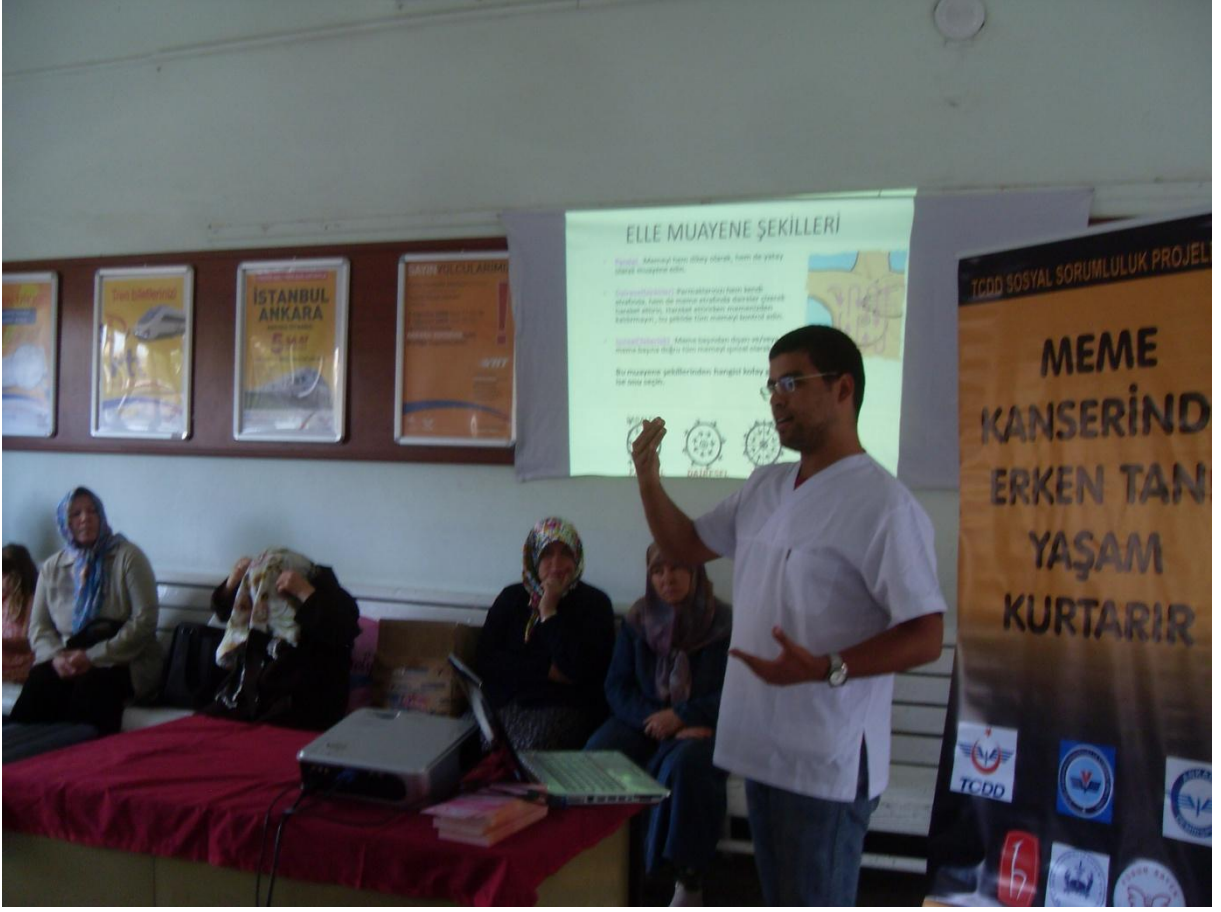
Bilecik Tren Garı etkinliđi